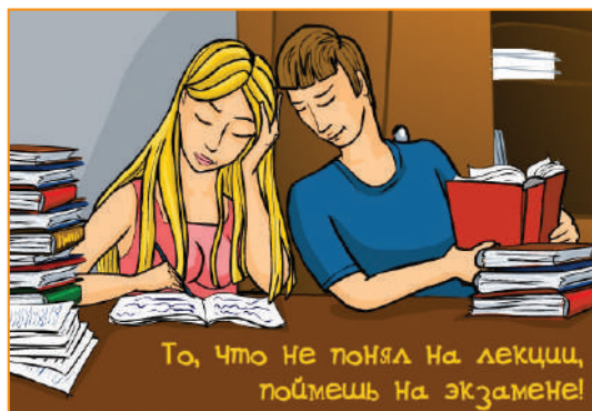
То, что не понял на лекции, поймешь на экзамене!