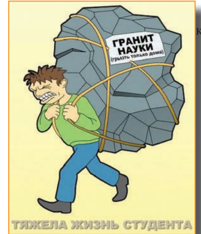
ТЯЖЕЛА ЖИЗНЬ СТУДЕНТА